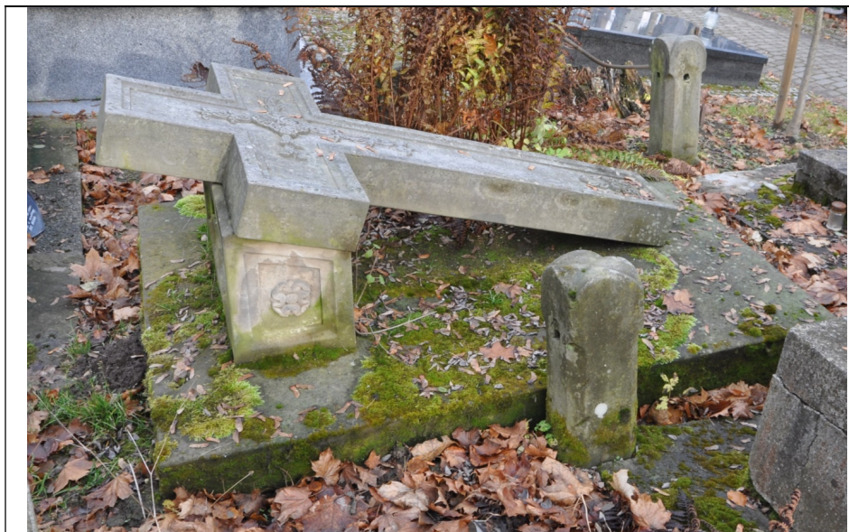
Nagrobek NN, przed konserwacją.

Po zaakceptowaniu projektu budżetu przez Walne Zebranie