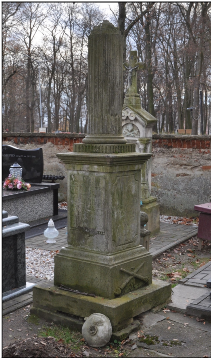
Nagrobek Rodziny Jaworskich z 1844 r. przed konserwacją.