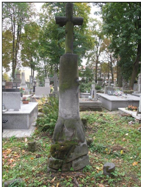
Nagrobek Jana Piętki

Stowarzyszenie SKOCK liczy 25 członków zwyczajnych. Zarząd pracuje w 5 osobowym składzie. W okresie sprawozdawczym odbył 4 posiedzenia: 11 V, 12 i 21 X, 15 XII. Frekwencja członków zarządu wyniosła średnio 90%. Zarząd podpisał umowę na prowadzenie