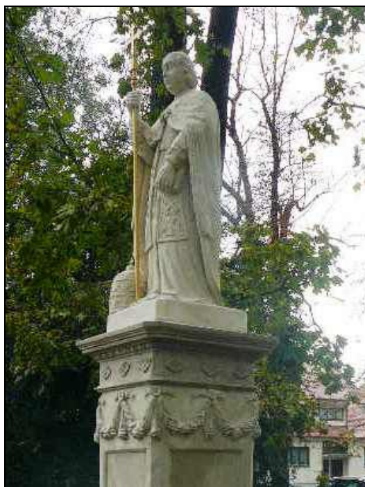
Figura papieża Aleksandra I (1871)

Teren wokół drewnianego kościoła Św. Wojciecha (kościół spalili Austriacy w 1809 r.) od XVIII w. był wykorzystywany na cmentarz parafii kolegiackiej. Po uruchomieniu Cmentarza Katedralnego w 1792 r. został zamknięty. Dopiero w 1831 r. – ze względów sanitarnych – zaczęto na dawnym cmentarzu przykościelnym Św. Wojciecha grzebać zmarłych na cholere