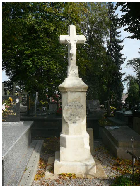
Nagrobek Pawła Kielbasy (1882)

Spoleczny Komitet Odnowy Cmentarza Katedralnego w Sandomierzu podczas kwesty zorganizowanej w dniach 30.10–01.11.2015 r. uzyskał środki finansowe w wysokości 13 857 zł. Wszystkim osobom, które wzięły udział w przygotowaniu i organizacji kwesty,